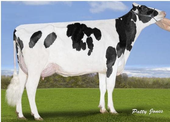
SILVERRIDGE DUKE ELSA-P DAM